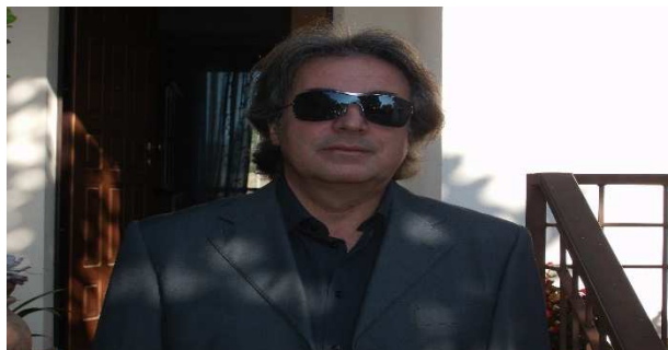
Il Presidente Nevino Barbanera

-Pagina 5/8 Bando Premio poesia “Vito Ceccani” VII edizione 2018 Scadenza 31/05/2018.