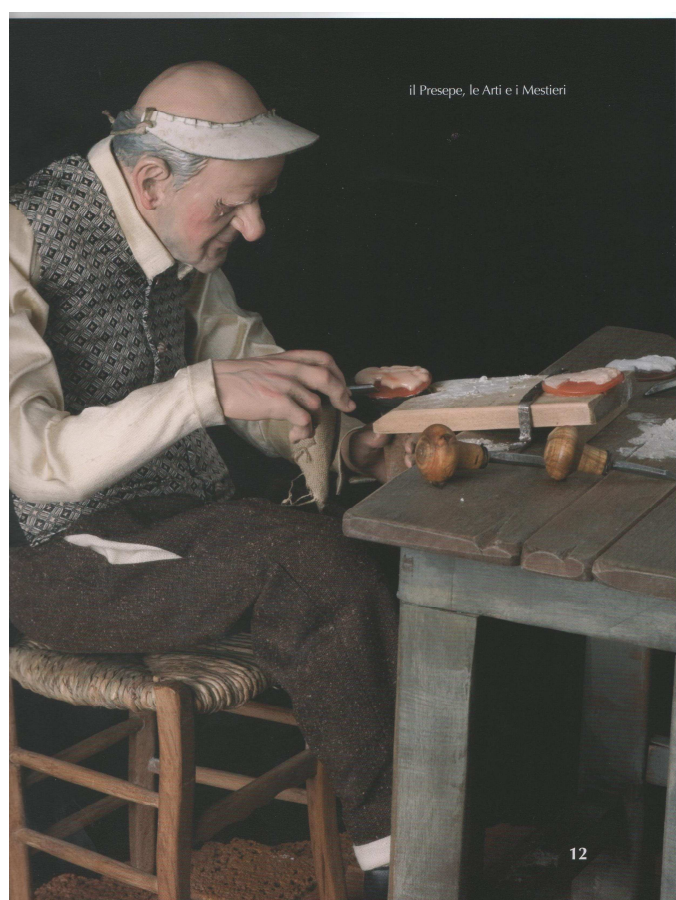
il Presepe, le Arti e i Mestieri

Albergo Casa Rossa 1888 Via Mortelle 60 80059 Torre del Greco (Na) Tel: 081 8831549 Fax: 081 8474602 www.casarossa1888.it